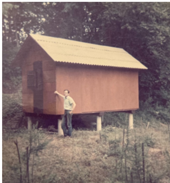
Slika 4: Pokraj kuće na adi, rijeka Una, 1986. godina

U istom intervjuu Matijević nastavlja da mu je i dalje glavni hobi likovna primijenjena umjetnost jer ima snažnu unutarnju želju stalno nešto vlastitim rukama i alatima raditi. Matijević je od različitih materijala izrađivao predmete različite namjene: drveni objekti po principu Montessori škole, visak, stilizirano prstenje itd. (slike 5 i 6). Svi ti predmeti zadovoljavaju uporabnu funkciju, dok je kod mnogih primijenjena i likovna dekoracija i stilizacija oblika.