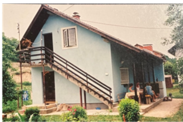
Slika 2: Vikendica u Blatni, BiH

Kasnije su profesoru Matijeviću likovna umjetnost i tehničke aktivnosti postale glavnim hobijima tako da je, bez profesionalnih majstora, s prijateljima i kao glavni majstor, izgradio jednu kuću od temelja do krova (slike 1 i 2) te još dvije kuće po modelu roh-bau. Matijević je sam osmislio i sa suprugom izgradio vikendicu na adi rijeke Une, za koju su materijal dopremili iz Majura u Hrvatskoj i tako na novim temeljima, od materijala kojim je bila izgrađena stara kuća, sagradili vikendicu za odmor (slike 3 i 4).