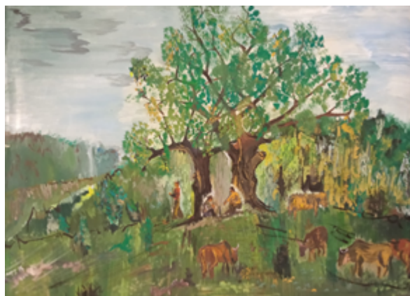
Slika 8: Pejzaž, tempera, 25 x 30 cm

Promatrajući većinu likovnih radova Milana Matijevića može se zaključiti da mu je likovno izražavanje omogućilo izraziti ljubav i privrženost zavičaju na poseban način. Tako će se u likovnoj mapi profesora Matijevića pronaći mnogi likovni zapisi pejzaža u kojem je rođen i odrastao (slike 7 i 8), u vidu crteža, najčešće starih kuća i slika na kojima prikazuje brda i rijeku Unu. Na svim tim crtežima i slikama Matijević nastoji s mnogim detaljima predložiti jasniji izgled motiva, što sigurno pokazuje i njegov emotivni odnos prema motivu. Kao osoba nemirnog i kreativnog duha Matijević se, kako u znanstvenom tako i u likovnom istraživanju, prepuštao eksperimentiranju. Tako njegovi radovi pokazuju kombinaciju istraživanja i eksperimentiranja, u tehnikama i materijalima, koristeći olovku, ugljen, temperu, akril, akvarel, ali i propitivanje motiva, pa ćemo u njegovoj likovnoj mapi osim pejzaža pronaći brojne studije autoportreta, portreta, figura, šaka i mrtve prirode (slike 9 i 10).