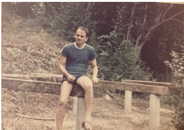
Slika 3: Na temeljima kuće na adi, rijeka Una, 1986. godina