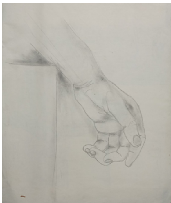
Slika 9: Studija šake, M. Matijević. Olovka na papiru, 40 x 35 cm

Promatrajući većinu likovnih radova Milana Matijevića može se zaključiti da mu je likovno izražavanje omogućilo izraziti ljubav i privrženost zavičaju na poseban način. Tako će se u likovnoj mapi profesora Matijevića pronaći mnogi likovni zapisi pejzaža u kojem je rođen i odrastao (slike 7 i 8), u vidu crteža, najčešće starih kuća i slika na kojima prikazuje brda i rijeku Unu. Na svim tim crtežima i slikama Matijević nastoji s mnogim detaljima predložiti jasniji izgled motiva, što sigurno pokazuje i njegov emotivni odnos prema motivu. Kao osoba nemirnog i kreativnog duha Matijević se, kako u znanstvenom tako i u likovnom istraživanju, prepuštao eksperimentiranju. Tako njegovi radovi pokazuju kombinaciju istraživanja i eksperimentiranja, u tehnikama i materijalima, koristeći olovku, ugljen, temperu, akril, akvarel, ali i propitivanje motiva, pa ćemo u njegovoj likovnoj mapi osim pejzaža pronaći brojne studije autoportreta, portreta, figura, šaka i mrtve prirode (slike 9 i 10).