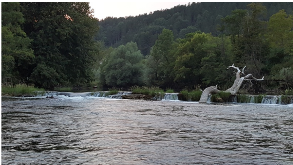
Slika 14: Panj na slapu, fotografirao M. Matijević, 2017. godina

ostali likovni radovi ostali poznati, do sada, samo obitelji.