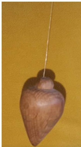
Slika 6: Visak, drvo

Odgovarajući na pitanja novinara Matijević izjavljuje da bi i danas poželio takvu kombinaciju za životni vijek – kombinaciju učiteljskih i pedagoških poslova s likovnom i tehničkom kulturom. U prilog temi našeg rada i tvrdnji koje o njemu iznosimo ide i podatak da je, radeći u odgojno-popravnom domu u Glini, Matijević vodio likovnu interesnu skupinu te da se dobrovoljno javio 2010. godine u ekspertnu grupu za nacionalni okvirni kurikulum za područje tehničke kulture, misleći