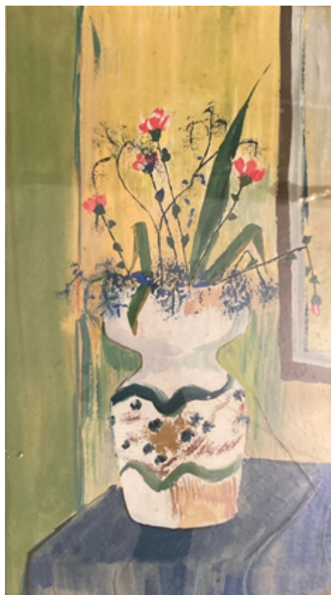
Slika 16: Vaza s cvijećem, tempera na papiru, 30 x 20 cm

Pisani radovi Milana Matijevića, koje smo naveli u ovom radu, a u kojima je isticao položaj likovnog odgoja i likovne kulture u školama i gdje je ukazivao na mnoge problema i pogreške (Matijević i sur., 2016a; Matijević i sur., 2016b; Drljača i sur., 2020a; Drljača i sur., 2020a), kao i njegovi likovni radovi, svjedoče o važnosti koju je pridavao likovnoj umjetnosti i likovnom izražavanju za život djeteta i učenika, ali i za njega osobno. Na kraju možemo iskazati zaključak u vidu pretpostavke u kojoj naslućujemo da je bilo sreće i vremena Matijević bi nastavio intenzivnije likovno eksperimentirati i istraživati, a za ishod imali bismo bogatu i vrijednu ostavštinu likovnih promišljanja profesora Matijevića. Sudeći prema radovima iz mape i nekim razmišljanjima koje je i usmeno iskazivao, njegovo bi likovno izražavanje zadržalo prepoznatljive motive, ali bi sigurno produbljivao i apstraktni izraz koji bi mu lakše omogućavao jednostavno simboličko izražavanje.