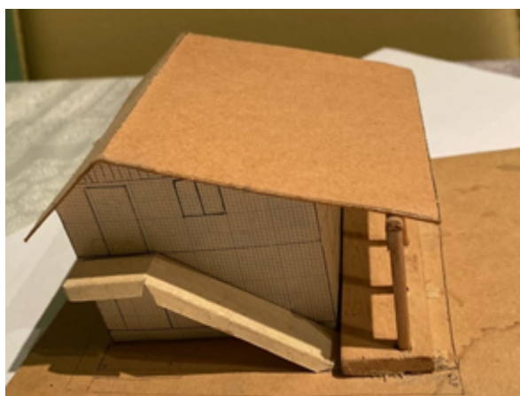
Slika 1: Maketa vikendice u Blatni, BiH

Koliki je značaj likovne umjetnosti i likovnog odgoja bio za život i rad Milana Matijevića vidi se ne samo iz njegovih znanstvenih i stručnih radova u kojima je isticao važnost umjetničkog izražavanja i učenja rukama, nego i iz mnogih privatnih razgovora i likovnih radova, ali i različitih uporabnih predmeta koje je Matijević izrađivao. U jednom od posljednjih intervjua Matijević (2019) je najbolje objasnio što je za njega predstavljala likovna umjetnost. Na pitanje da li bi na svom profesionalnom putu i životu nešto mijenjao i da li bi ponovno izabrao istu profesiju da se vrati u mladost, odgovorio je da su mu poznate riječi hrvatskog učitelja Ivana Filipovića: Da se deset puta rodim, deset puta bio bih učiteljem! Ali u njegovom slučaju ne bi mogao biti baš tako eksplicitan s odgovorom. Objašnjavajući takav stav navodi da je u tinejdžerskim danima razmišljao o tome što bi želio raditi i kako živjeti te je imao dvojbu između upisivanja srednje građevinske ili učiteljske škole. Kako je za građevinsku školu trebalo osigurati stanovanje u drugom velikom gradu, a roditelji to nisu uspjeli riješiti, izabrao je alternativu: učiteljsku školu. Ističe da je tu imao sreću jer su u programu učiteljske škole likovna i tehnička kultura s metodikama imali zapaženo mjesto i imali su za ta područja dobre nastavnike i dobre kabinete pa je tamo zadovoljio i te osobne aspiracije.