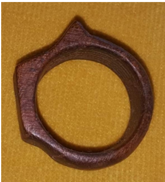
Slika 5: Prsten, drvo

U istom intervjuu Matijević nastavlja da mu je i dalje glavni hobi likovna primijenjena umjetnost jer ima snažnu unutarnju želju stalno nešto vlastitim rukama i alatima raditi. Matijević je od različitih materijala izrađivao predmete različite namjene: drveni objekti po principu Montessori škole, visak, stilizirano prstenje itd. (slike 5 i 6). Svi ti predmeti zadovoljavaju uporabnu funkciju, dok je kod mnogih primijenjena i likovna dekoracija i stilizacija oblika.