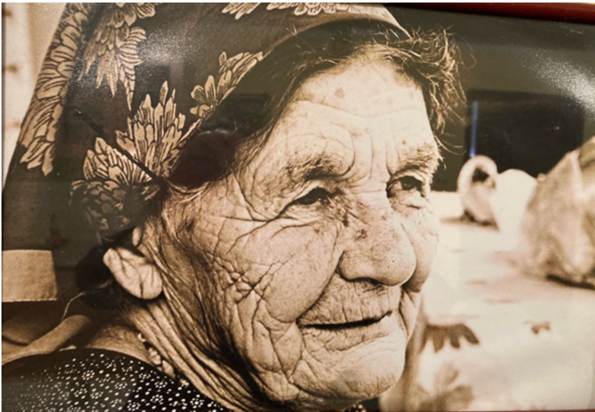
Slika 13: Portret majke, fotografirao Milan Matijeвиć, 2012. godina

Fotografija je bila ta koja ga je najviše držala, osobito u posljednje vrijeme te je inzistirao na fotografiranju tijekom svakog obiteljskog okupljanja, a često je radio i portrete članova obitelji. Ovom prigodom prikazujemo nekoliko portreta članova obitelji nastalih u različitom vremenskom razdoblju (slike 11, 12 i 13).