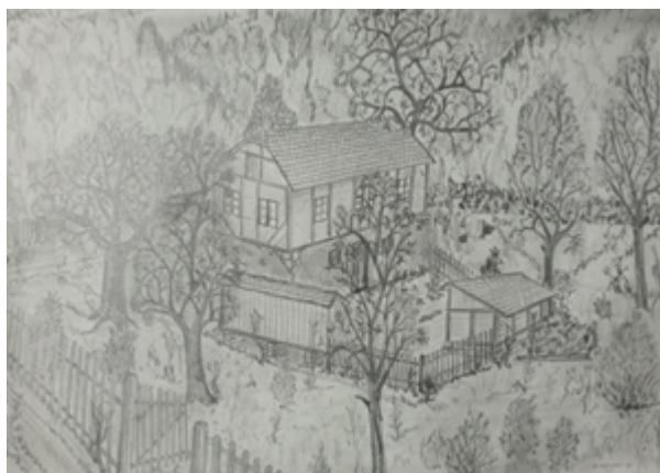
Slika 7: Stara kuća, olovka na papiru, 25 x 30 cm

naivno da će tu imati više prilike upozoriti na važnost učenja rukama tijekom obvezatnog školovanja.